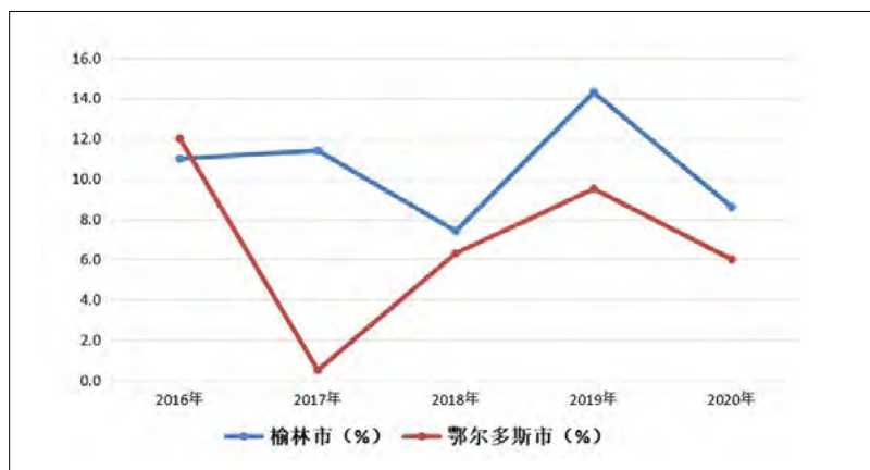
图1 近年来两市固定资产投资增速对比